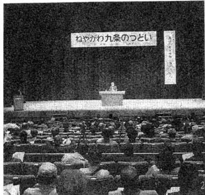
ねやがわ九条のつどい

最後に「憲法・教育基本法改悪阻止するには、私たちが草の根からどう声をあげ、広げていくかが大事。憲法第九条はいま、世界の