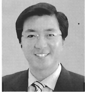
元参議院議員・党府副委員長