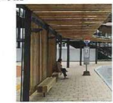
(イメージ)バスシェルターの美装化

バスシェルター(美装化) 現在のシェルターは、透過性の高いガラス製のため、日差しを遮る効果が低いことから、木材等を活用した美装化を実施