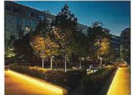
(イメージ)緑化施設等の改修

緑化施設等の改修(全体) 植栽とベンチ、間接照明によるデザイン性の高い空間に改修