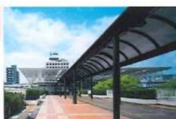
(イメージ)ペDESTリアンデッキへの屋根の設置

ペDESTリアンデッキの改修等 公共施設間の往來の快適性等の向上のため、ペDESTリアンデッキへの屋根の設置、地下通路の美装化(照明設備の改修等)を実施