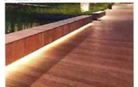
(イメージ)歩行空間の整備