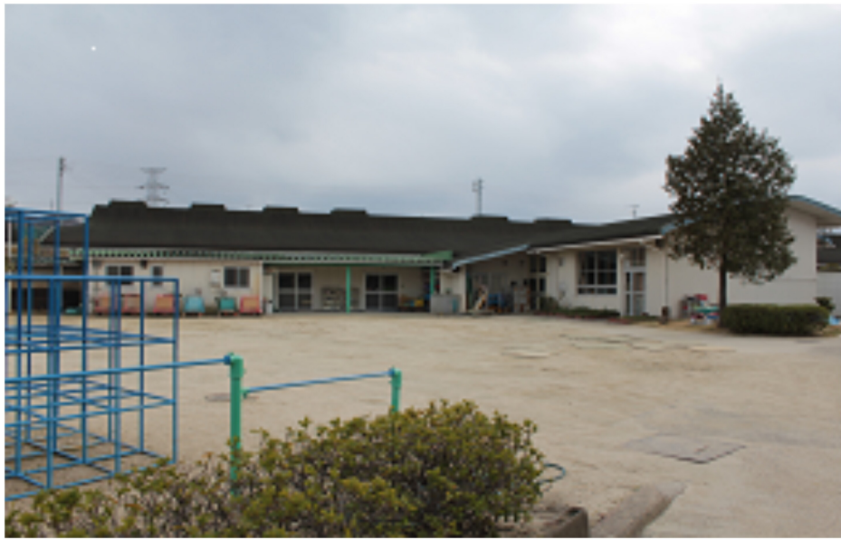
寝屋川市立あかつき・ひばり園